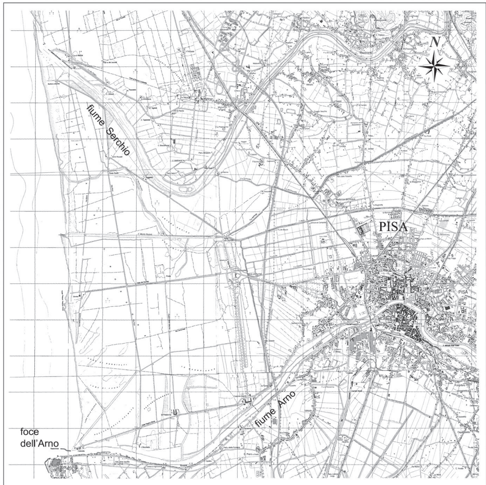
fig. 34 Carta di inquadramento generale della piana di Pisa compresa tra L'Arno e il Serchio (Carta degli elementi naturalistici e storici della pianura d Pisa e dei rilievi contermini, scala 1:50.000 ridotta).