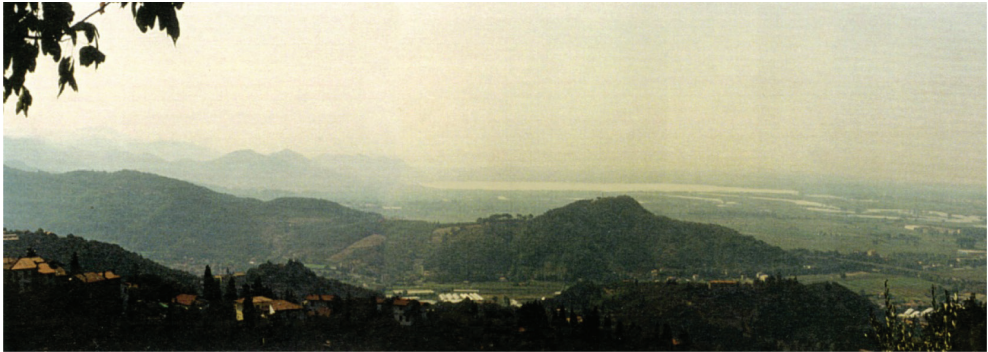
fig. 37 Veduta panoramica della Versilia vista dalle Apuane, sullo sfondo il lago di Massaciuccoli (foto a cura di R. Buggiani, agosto 2000).