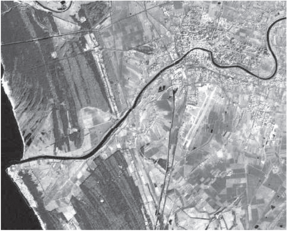
fig. 38 Immagine satellitare dell'andamento del fiume Arno da Pisa sino alla foce. In particolare alla foce la progressione verso mare del delta è stata piuttosto rapida come si può notare dalla forte convergenza che caratterizza i vari cordoni. La tendenza erosiva che ne è seguita, determinata dal netto calo delle sedimentazioni ha comportato l'arretramento della spiaggia. Tale fenomeno, iniziato nel XVIII, è più evidente nel lobo destro della foce che ha spazzato via una fetta di territorio ampia più di 1 km. ed i vecchi cordoni sabbiosi intersecano oggi la linea di riva. Il versante opposto invece è stato difeso con interventi di opere marittime che hanno impedito l'arretramento della costa dando origine alla forte asimmetria della foce.