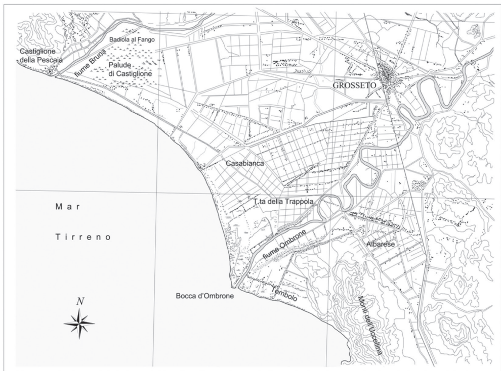
fig. 27 Restituzione planimetrica della piana di Grosseto alla foce dell'Ombrone impiegando i fogli I.G.M. del 1943: F.127 Piombino; F.128, Grosseto; F.135 Orbetello, Serie 100V (elaborazione grafica a cura dell'Autrice).