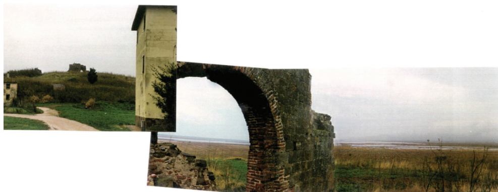
fig. 33 La Badiola al Fango. Ruederi affacciati sull'ambiente palustre della Diaccia Botrona (foto a cura di R. Buggiani, agosto 2000).