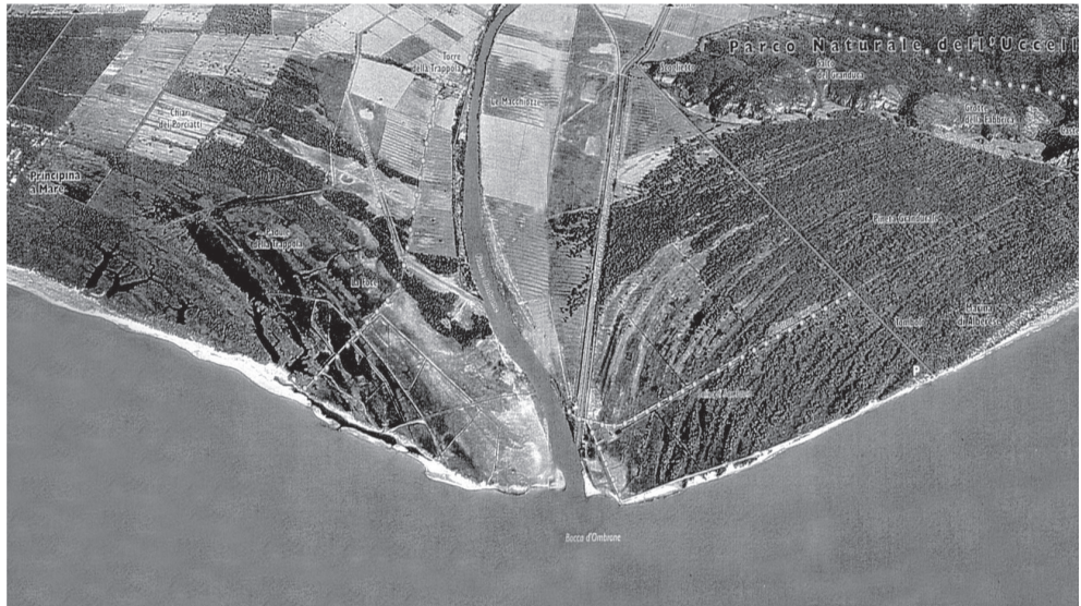
fig. 30 Innagine aerea della foce dell'Ombrone. La progressione verso mare delle dune costiere tendono a configurare una foce cuspidata crescente per giustapposizione di cordoni dunari ad andamento prima lineare e poi curvilineo, capaci di riempire progressivamente il vecchio seno marino su cui si affacciano cale e calette orlate da ripe rocciose prodotte dall'erosione del mare e tuttora visibili.