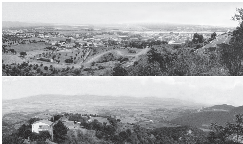
fig. 29 La piana alluvionale di Grosseto. In alto vista da Castiglione della Pescaia; in basso vista da Vetulonia.