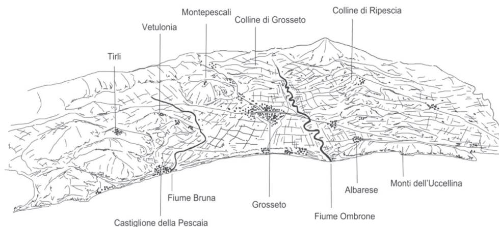
fig. 28 Schema tridimensionale della pianura di Grosseto. In primo piano la fascia costiera e la piana grossetana protesa verso l'interno con la città di Grosseto, circondata da colline restostanti e solcata dai fiumi Ombrone a destra e Bruna a sinistra che si gettano nel Tirreno (elaborazione grafica a cura dell'Autrice).