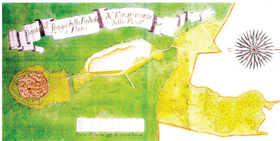
fig. 32 La Badiola al Fango nel lago di Castiglione della Pescaia, Leonardo Ximenes, 1765-70. All'interno del lago di Castiglione già Lacus Prilius , si spingeva una penisola, ora rappresentata da una collinetta che sovrasta l'adiacente palude della Diaccia Botrona. Attualmente è chiamata Badiola al Fango a significare l'ultima destinazione d'uso da parte di una comunità religiosa. Per le sue caratteristiche peninsulari essa è stata popolata, fin dall'epoca imperiale e poi nella successiva epoca medievale e rinascimentale, come luogo di pesca e lavorazione dei prodotti ittici. Scavi archeologici hanno messo in evidenza una stratificazione di strutture e funzioni abitative, produttive e conventuali.