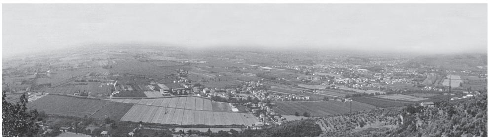
fig. 35 La piana di Pisa vista dal monte Pisano (foto a cura di R. Buggiani, agosto 2000).