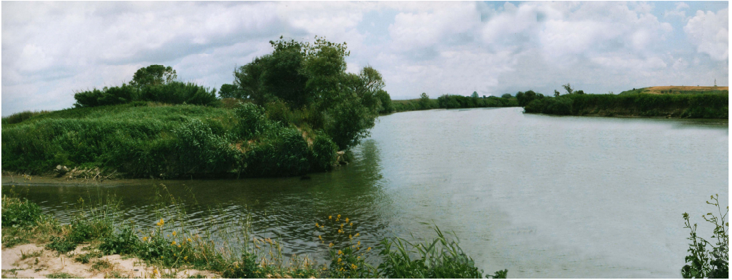
fig. 31 Confluenza del fosso Galeria nel Tevere dove il fiume ormai prossimo al mare si allarga ampliando il suo letto.