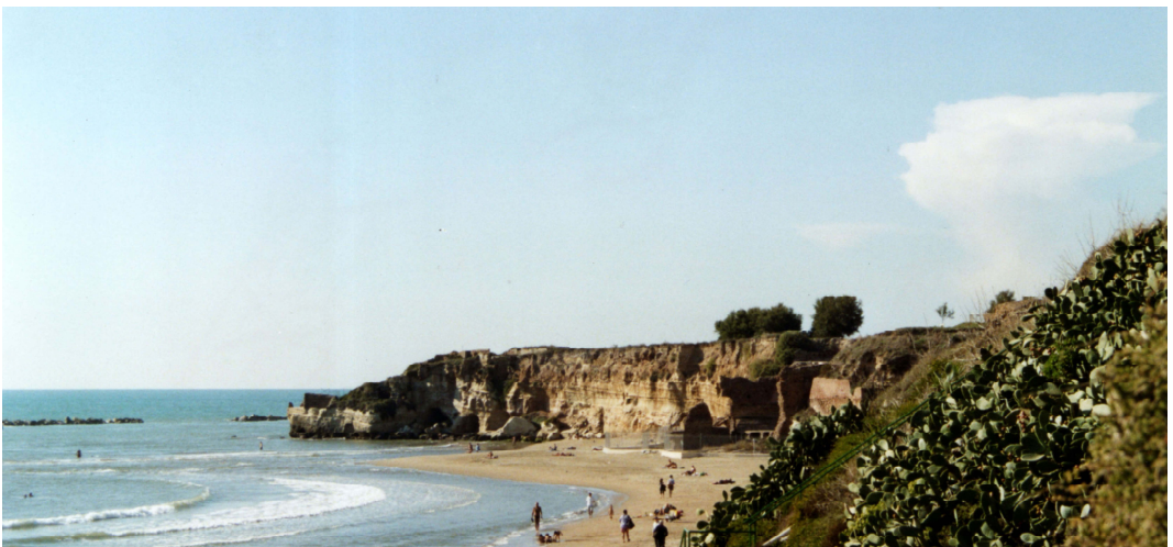
fig. 32 La costa a falesia ingloba le strutture del porto di Nerone ad Anzio.