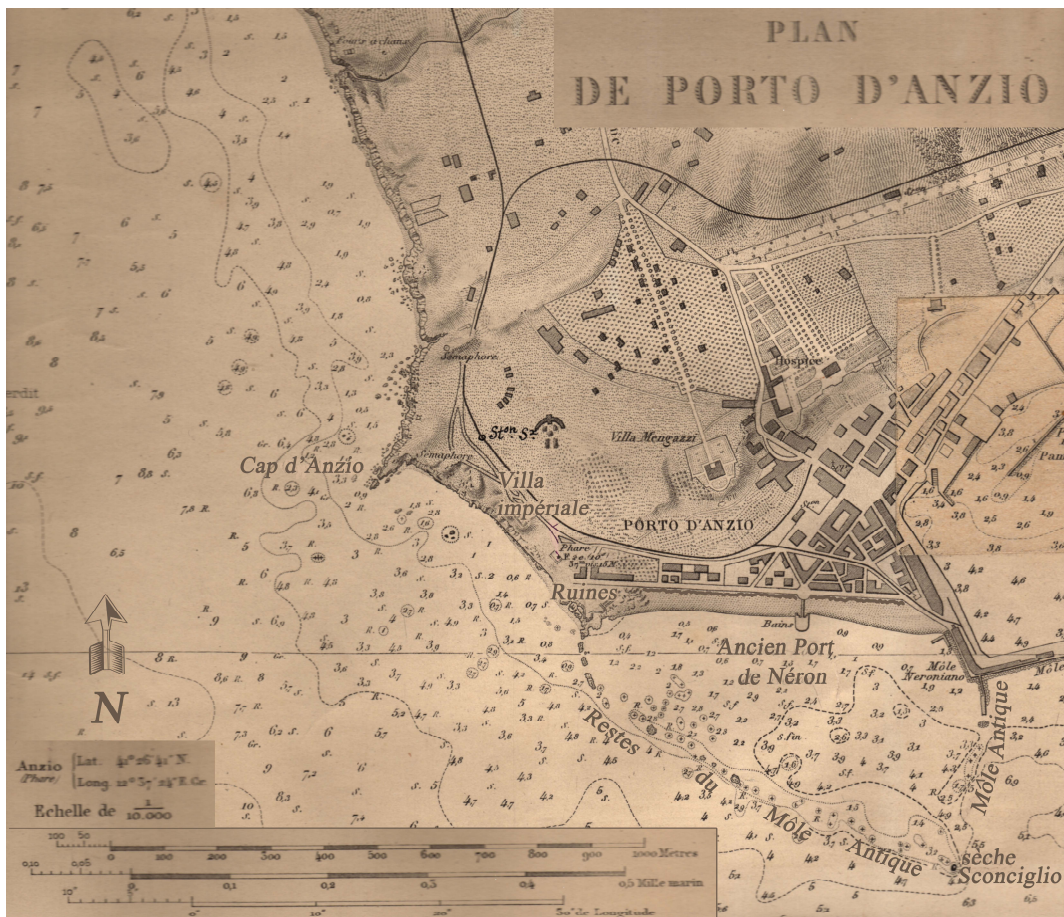
fig. 33 Anzio, in basso a destra, pianta del porto di Nerone, inquadrato nella cartografia nautica del 1859 ( Dèpot des Carte set Plans de la Marine ) sotto la direzione di M r . Darondeau ingegnere idrogeografico, Dipartimento della Marina.