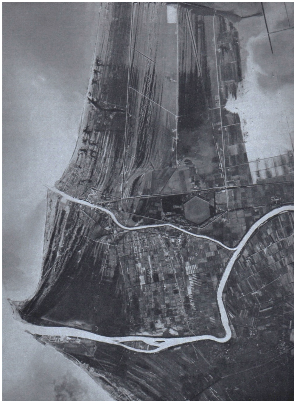
fig. 8 Foto aerea zenitale del 1944 della Royal Air Force. Evidente è l'assenza degli insediamenti urbani di Ostia e Fiumicino con al loro posto una sequenza di dune costiere ad andamento convergente in direzione della foce di Fiumara Grande. Ben visibile a nord la Fossa Traianea affiancata dalla sagoma esagonale del porto di Traiano e il nuovo corso del meandro provocato dalla inondazione del 1557, che ha allontanato dal fiume sia l'antico abitato di Ostia sia il borgo medievale di Gregoriopoli (da R. Almagià).