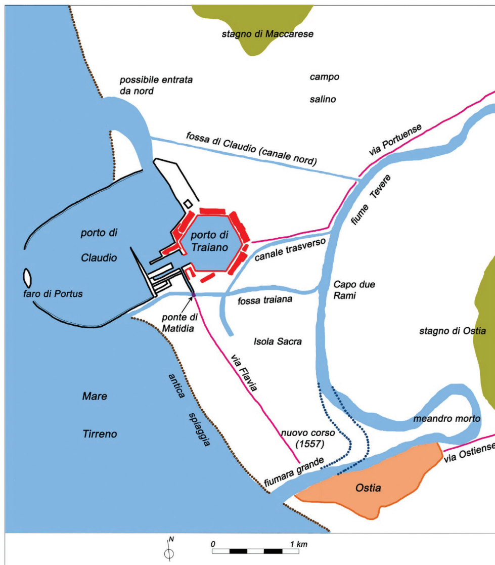
fig. 9 Disegno ricostruttivo del Portus Augusti . In nero il porto di Claudio, in rosso la darsena esagonale progettata da Apollodoro di Damasco su proposta dell'imperatore Traiano (elaborazione grafica a cura dell'Autrice).